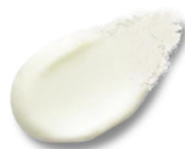
「ぽてさら」テクスチャー

吸水ポリマーを化粧品に応用し、塗布時の水のような感触とサラリとした仕上がりを両立した点が高く評価された。日焼け止めはべたつきや塗り直しのしづらさが不満として挙げられ、日常使用を妨げる原因となってきた。育児経験から得た着想をもとに、吸水ポリマーを配合した独自のテクスチャーを開発することで、快適な使い心地とともに、一年を通じて使われる日焼け止めとして市場の可能性を広げることが期待される。新しい発想と処方技術が、日常的なスキンケア体験を刷新するデザインとなっている。